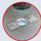
Силиконовая подложка и нижняя подсветка