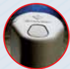
Кнопка для захвата фото и видеоизображения