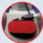
Шнур питания наматывается на держатель на задней стенке микроскопа