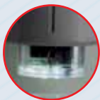
Легко поворачивающаяся турель с объективами и верхней подсветкой